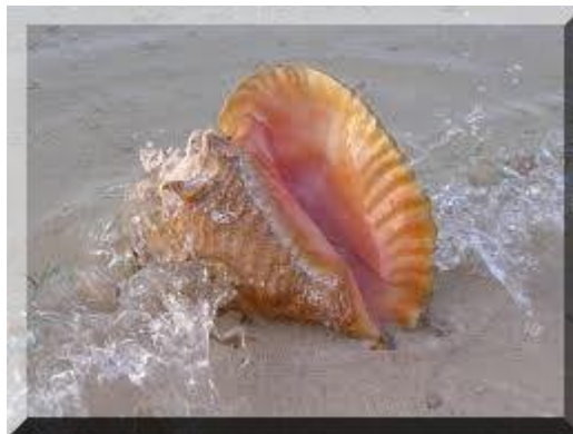
T'ot' (Caracol / Concha)

Cuando la luz del Sol nos ilumina, sus rayos nos hacen despertar la mente y nos encaminan hacia la obediencia. Los pies y las dos manos son tus herramientas para poder ayudar a los demás, a los necesitados. Servirás sin condiciones y así triunfarás sobre todos. Con eso estas abriendo una brecha para tu futuro, para que esa luz nunca se apague en tu camino. Esa luz es tu hogar. Se obediente y humilde y serás el ejemplo ante todos.