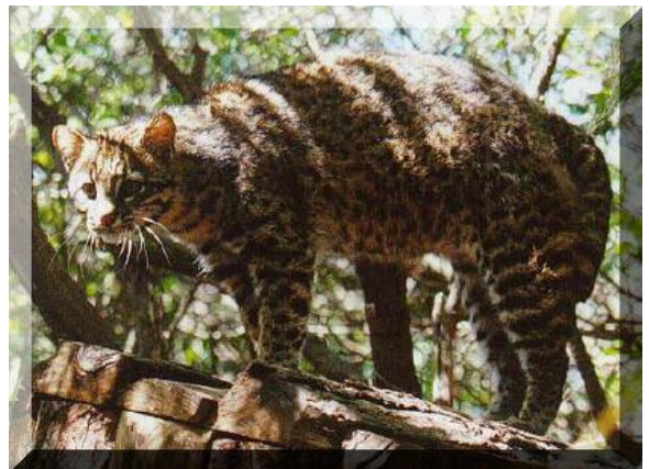
Gato de monte

Camino, destino, autoridad, alimento, viajes.