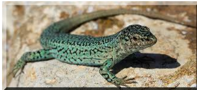
Petit lézard (Lagartija)

En ce jour K'at, on demande pour retirer les mauvaises énergies, défaire les nœuds qui nous attachent aux vices, pour régler les problèmes émotionnels, pour l'unité de la communauté, la fécondité de la femme, que les enfants se développent physiquement et mentalement.