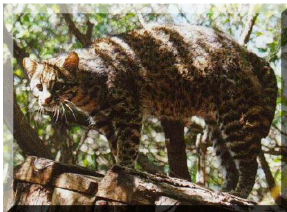
Chat de montagne / Lynx

Ce jour s'utilise pour demander du travail.