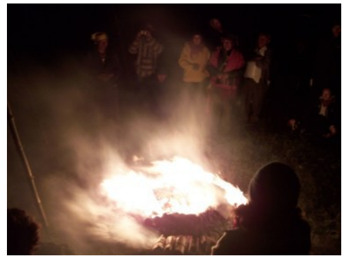
Photo de cérémonie : Wajxakib' B'atz' à Los Encuentros, 4 septembre 2008